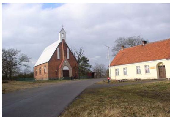
Zdj. Miejsce lokalizacji parkingu w Dobrojewie

Działanie skierowane na rzecz poprawy bezpieczeństwa i wygody ruchu pieszego i