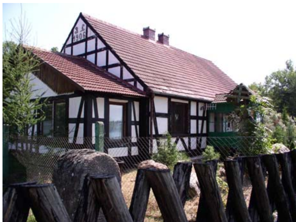
Zdjęcia: Kościół, Muzeum etnograficzne