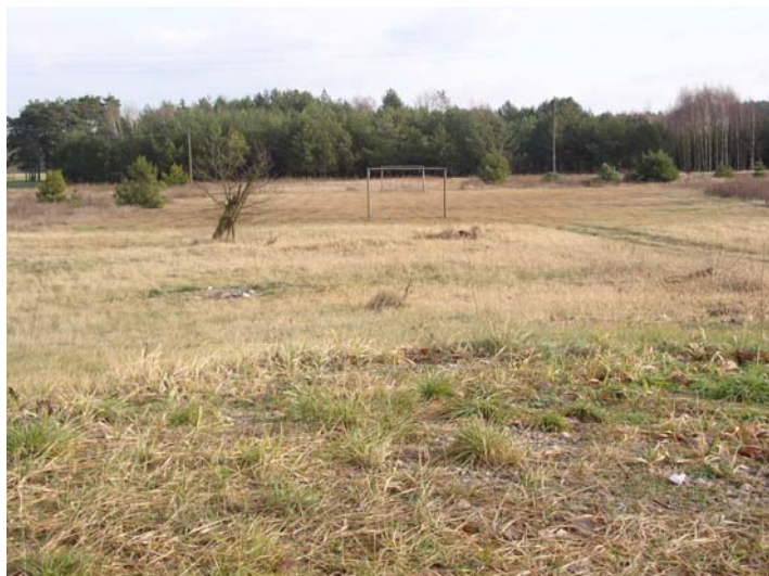
Zdj. Miejsce lokalizacji placu zabaw i boiska sportowego

Wykonanie placu zabaw dla najmłodszych mieszkańców miejscowości ma na celu zapewnienie przyjemnego i bezpiecznego spędzenia czasu wolnego przez dzieci i młodzież. W Dobrojewie do tej pory nie ma żadnego placu zabaw dla dzieci. Najbliższy mieści się w oddalonym o kilka kilometrów Gościnowie. Planuje się zakupić urządzenia drewniane dla dzieci tj. „małpi gaj”- urządzenie wielofunkcyjne wyposażone w elementy sprawnościowe, drabinki, huśtawki wagowe, huśtawki łańcuchowe, ławki parkowe, nasadzenia drzew itp.