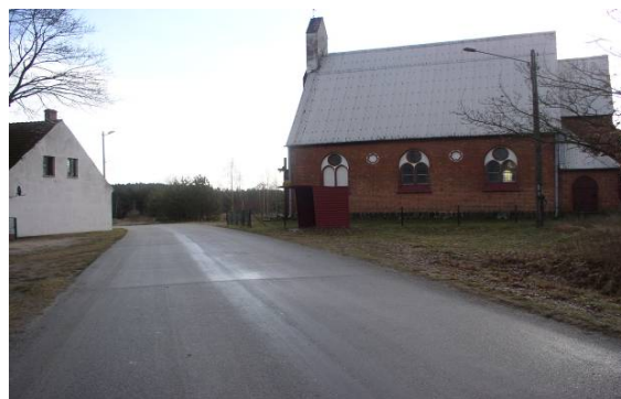
Zdj. Świetlica wiejska w miejscowości Dobrojewo

Remont świetlicy umożliwi powstanie lokalu, w którym będą mogli spotykać się mieszkańcy wsi, przede wszystkim dzieci i młodzież; pozwoli na organizowanie imprez, festynów wiejskich czyli ogólnie rzecz biorąc pobudzi do aktywniejszego uczestnictwa w przedsięwzięciach kulturalnych mieszkańców wsi.