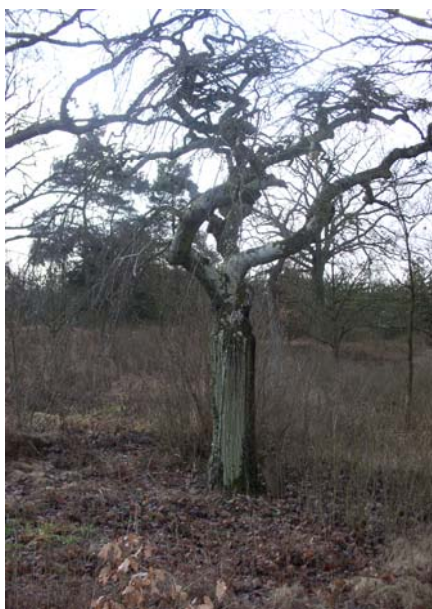
Zdj. Piękne drzewo z gatunku milorząb na starym cmentarzu w Dobrojewie