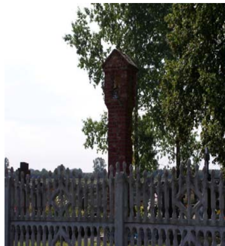
Rys. Kościół z XIX w, w Krobielewku, cmentarz

To tylko nieliczne z wielu zabytków, które oferuje Sołectwo. Wśród lasów i dróg można odkryć stare cmentarze, stare kamienne drogowskazy, pozostałości fortyfikacji i wiele innych.