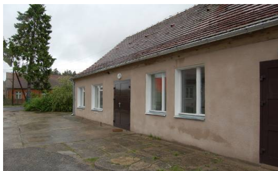
Zdj. Świetlica wiejska w miejscowości Krobielewko – stan obecny

Realizacja inwestycji przewiduje modernizację świetlicy wiejskiej, usytuowanej w niewielkiej odległości od placu zabaw. W miejscowości Krobielewko nie ma innego miejsca poza świetlicą, które byłoby centrum kulturalnym i ośrodkiem spotkań lokalnej społeczności tj. dzieci, młodzieży jak i również seniorów. Celem zadania jest stworzenie ośrodka kulturalnego dla wszystkich mieszkańców sołectwa, miejsca w którym dzieci i młodzież mogłyby spędzić czas, a dorośli uczestniczyć w życiu kulturalnym i towarzyskim.