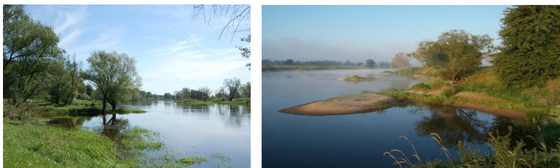
Rys. Rzeka Warta w okolicach Krobielewka

Wokół wsi rozciągają się wielkie lasy, największe w północnej jego części – Puszcza Notecka. Są rajem dla grzybiarzy, rowerzystów, amatorów ciszy, spokoju i pieszych wędrówek, jak również miejscem spotkań myśliwych, gdyż nie brak tu dzikiej zwierzyny. Sarny, jelenie, dziki, kuny czy lisy nie należą do rzadkości. Natomiast położenie przy nurcie rzeki Warty ma duże znaczenie i wpłynęło m.in. na to, iż Świniary stały się rezerwatem dla siedlisk bobrów, dostarczając wrażeń z wędrówek ich urozmaiconymi brzegami. Na podmokłych łąkach występują okazy roślinności błotnej i skupiska kilkunastu gatunków traw. Po całym terenie porozrzucane są kępy wodolubnych drzew, takich jak karłowate wierzby, olchy i trzciny. Tworzą one specyficzny pejzaż w równinnej zieleni łąk. Fauna tego terenu jest dość bogata. Często można tu spotkać na żerowaniu bociany białe i czarne oraz żurawie.