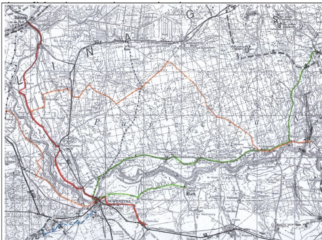
Zdj. Planowany szlak rowerowy – widoczne możliwe włączenie miejscowości Krobielewko