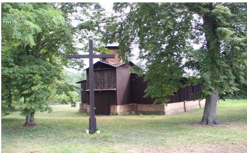
Zdj. Planowane miejsce budowy przed kościołem

Realizacja zadania polega na budowie parkingu przy kościele w Krobielewku. Inwestycja korzystnie wpłynie na poprawę wizerunku wsi i estetyki przestrzeni publicznej.