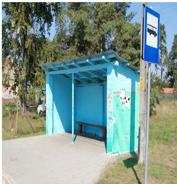
Zdj. Budynek remizy strażackiej, przystanek PKS w Krobielewku