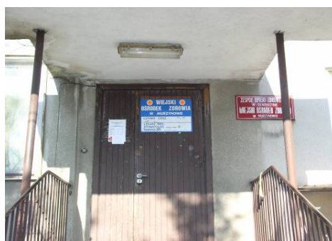
Zdj. Budynek Ośrodka Zdrowia w Murzynowie