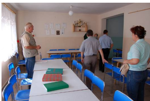
Zdj. Świetlica wiejska w Trzebiszewie

Realizacja inwestycji przewiduje modernizację świetlicy wiejskiej, usytuowanej w niewielkiej odległości od placu zabaw. W miejscowości Trzebiszewo, z wyjątkiem szkoły, nie ma innego miejsca poza świetlicą, które byłoby centrum kulturalnym i ośrodkiem spotkań lokalnej społeczności, tj. dzieci, młodzieży jak i również seniorów. Celem zadania jest stworzenie ośrodka kulturalnego dla wszystkich mieszkańców sołectwa, miejsca, w którym dzieci i młodzież mogliby spędzić czas, a dorośli uczestniczyć w życiu kulturalnym i towarzyskim.