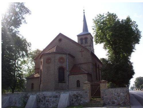
Zdj. Budynek Kościoła i Szkoły Podstawowej w Trzebiszewie