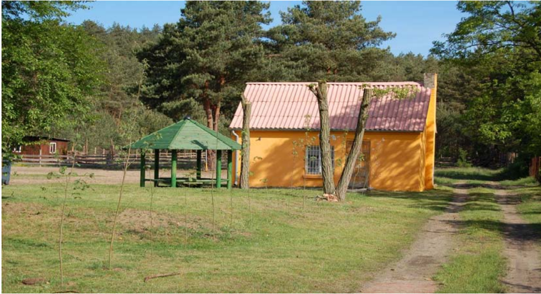
Rys. Budynek świetlicy wiejskiej stan na 2007r.

Celem projektu jest zaspokojenie potrzeb społecznych i kulturalnych mieszkańców Wiejce.