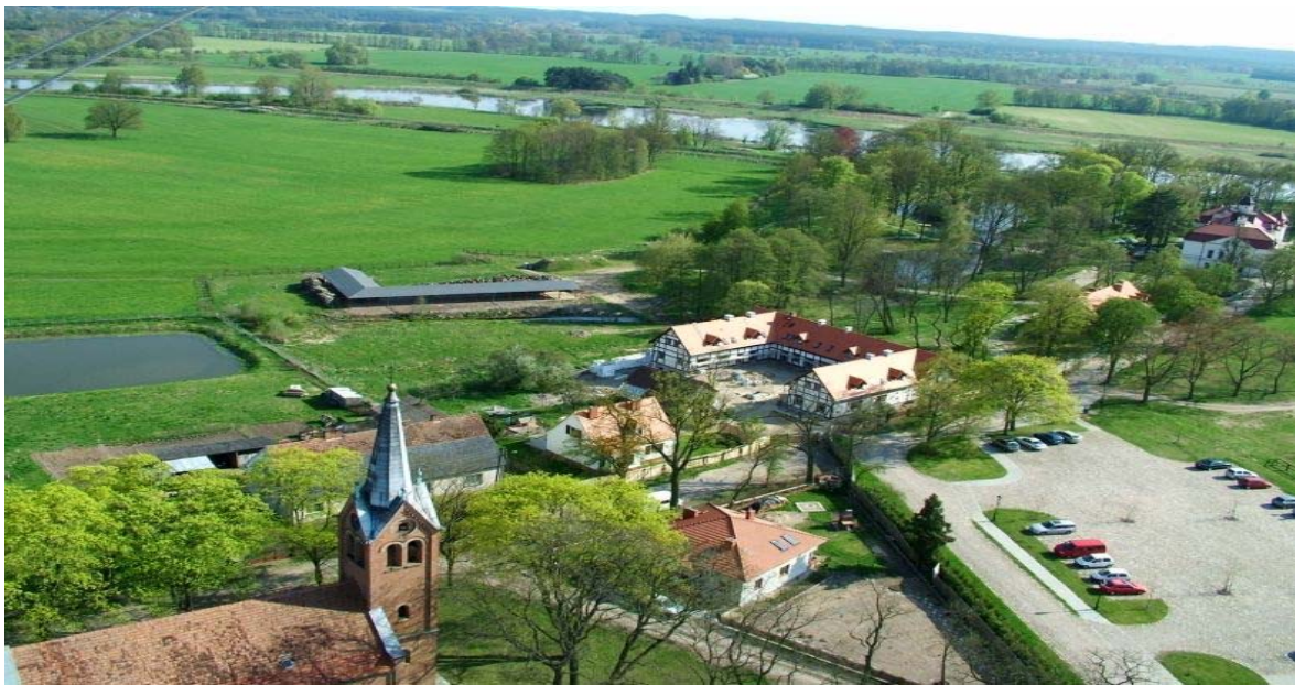
Rys. 1. Widok na okolicę z wieży Pałacu w Wiejcach

północny-wschód od Skwierzyny, przy drodze wojewódzkiej do Międzychodu. Jest to najdalej oddalona wieś od Skwierzyny. Wokół wsi rozciągają się lasy, największe w północnej jego części. Warunki naturalne jakie posiada wieś sprzyjają uprawianiu myślistwa, grzybobrania, wędkowania oraz turystyki pieszej i rowerowej. Na południe od wsi rozciąga się dolina Warty, na północ bezludne obszary leśne. Na północno-zachodnim skraju wsi wznosi się Galgerberg wysoka na 69,3 m n.p.m. „szubienicza góra”. We wsi zlokalizowany jest Ośrodek wypoczynkowy " Pałac Wiejce ". Przystanek PKS. Sklep.