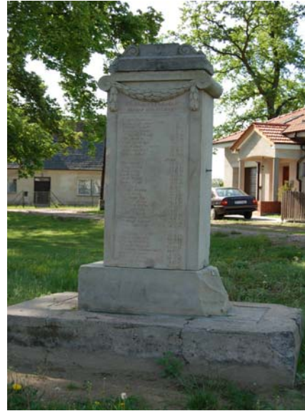
Zdj. Pomnik poległych w czasie I wojny światowej,