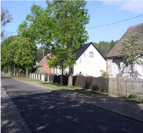
Zdj. Droga wojewódzka we wsi Wiejce

Realizacja zadania przewiduje poprawę oświetlenia sołectwa Wiejce poprzez zwiększenie ilości punktów świetlnych wzdłuż ciągu komunikacyjnego. Wdrożenie projektu wpłynie korzystnie na jakość infrastruktury drogowej we wsi. W konsekwencji nastąpi poprawa bezpieczeństwa ruchu, zwłaszcza pieszego, oraz stanu estetyki przestrzeni. Ponadto planuje się wykonać remont wieży kościoła. Obiekt objęty jest ochroną zabytkową ze względu na dużą wartość historyczno-kulturalną.