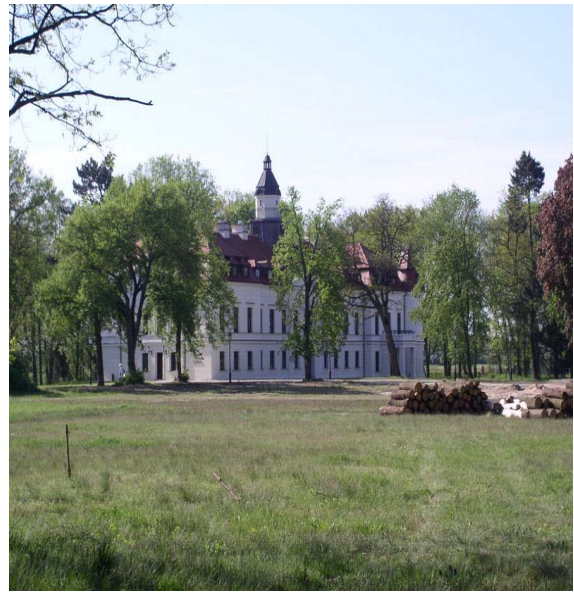
Zdj. Kościół w Wiejcach z przełomu XVIII i XIX w. i budynek pałacu