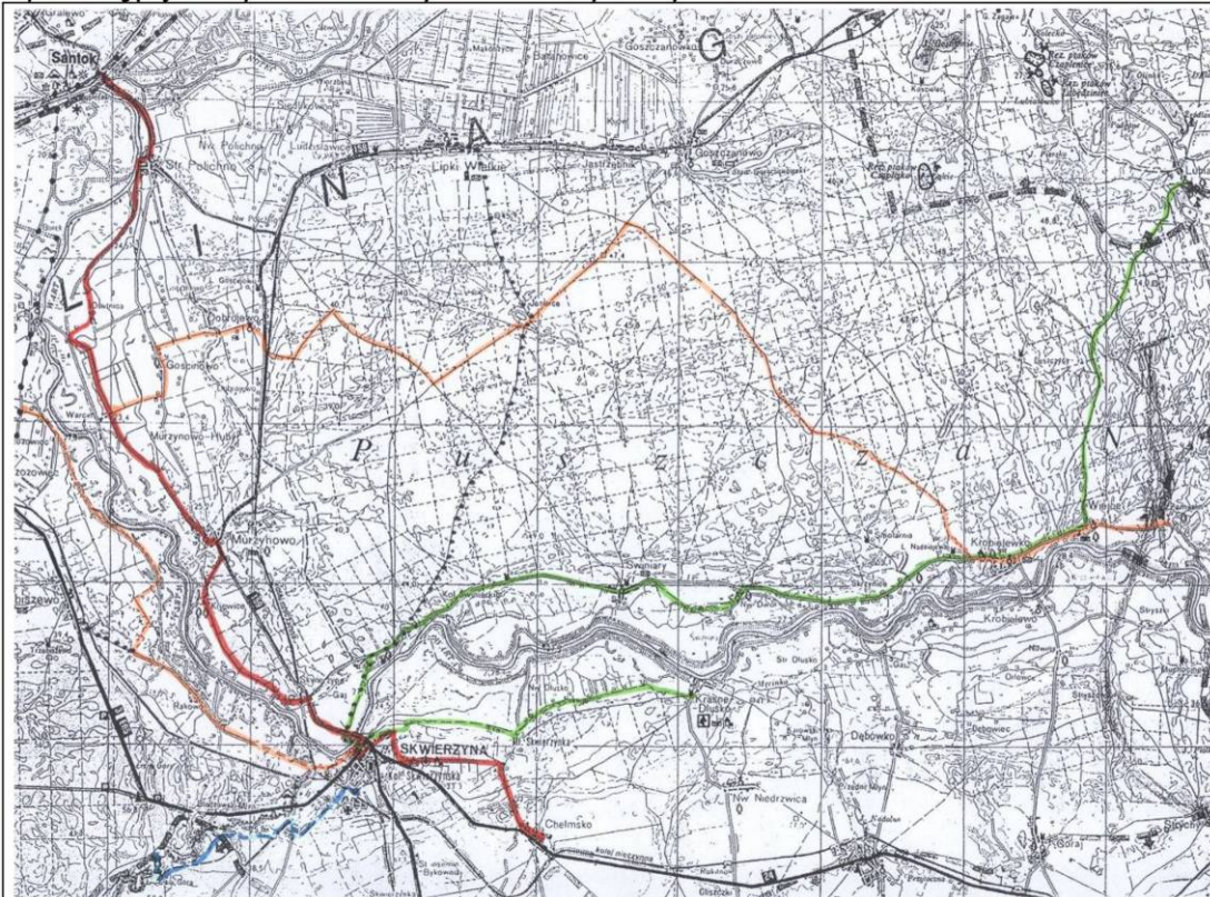
Zdj. Planowany szlak rowerowy – widoczne możliwe włączenie miejscowości Wiejce

Dla realizacji zadania istotny jest fakt, iż planowana budowa ponadregionalnego Szlaku Rowerowego stworzy możliwość przyłączenia miejscowości do wspólnego szlaku Lubiatów-Wiejce-Skwierzyna- Krasne Dłusko. Inwestycja zakłada zakup i montaż tabliczek, drogowskazów oraz tablicy informacyjnej. Realizacja zadania wpłynie korzystnie przede wszystkim na poprawę atrakcyjności turystycznej miejscowości i całej gminy.