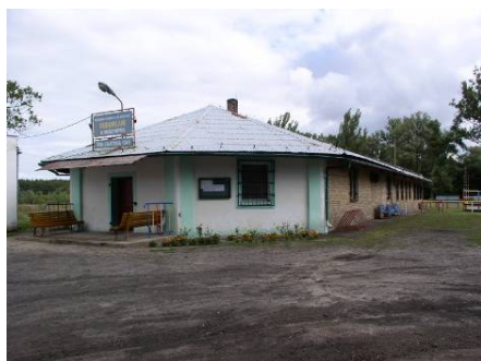
Zdj. Budynek Sali wiejskiej w Murzynowie

Adaptacja bazy sportowo-rekreacyjnej w celu zwiększenia atrakcyjności turystycznej wsi Murzynowo przy ul. Sportowej