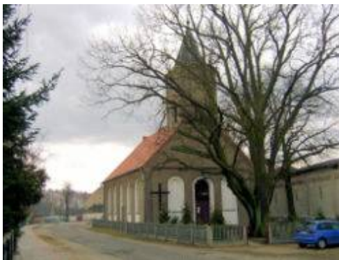
Rys. Kościół p.w. Niepokalanego Serca i zlokalizowany obok pomnikowy dąb szypułkowy, Figurka Matki