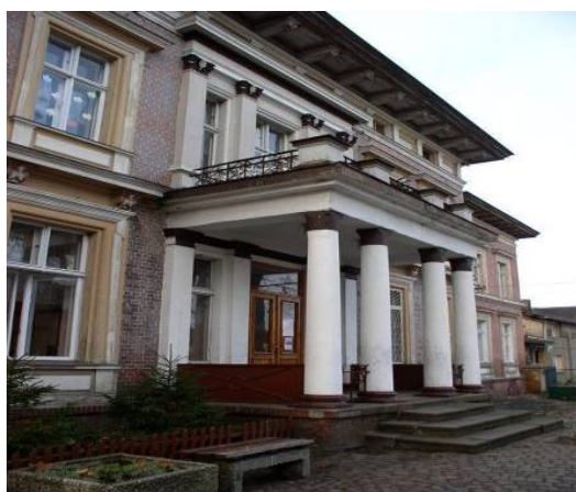
Rys. Budynek Szkoły Podstawowej w Murzynowie

Zajęcia dydaktyczne prowadzone są dla klas I-VI. Rozwój uzdolnień i zainteresowań uczniów szkoła umożliwia, organizując liczne konkursy oraz koła zainteresowań, a także imprezy kulturalno sportowe. Na dzień dzisiejszy Szkoła jest centrum kulturalnym wsi. Budynek szkolny wpisany jest do wykazu obiektów zabytkowych znajdujących się w ewidencji konserwatorskiej. Ze względu na historyczne wartości przestrzenne i architektoniczne podlega ochronie prawnej.